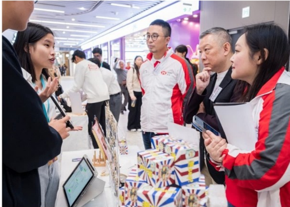
75間學生營運公司於兩日市集內積極銷售自家設計的新產品。

青年成就香港部 (JA HK) 主辦的 HSBC x JA 青年創業體驗計劃「創意市集」，於上週末 (3月8至9日) 在啟德零售館成功舉辦，逾1,800名14至18歲中學生首次創業，組成75間學生營運公司，從構思到成功推出產品，並於兩日市集內積極銷售自家設計的新產品，總營業額突破53萬港元。另外大會根據產品的原創性、設計及品質、對環境和社區的價值，以及技術應用為準則，頒發多個獎項，其中「最佳商品獎冠軍」由天主教郭得勝中學的Gen Sigma學生公司奪得。